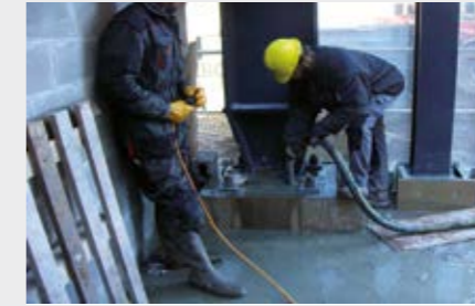
Verfüllen von Stahlstützen