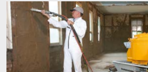
Lehmputz spritzen im Innenbereich