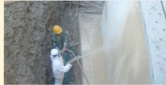
Beschichtung von Betonfundamenten