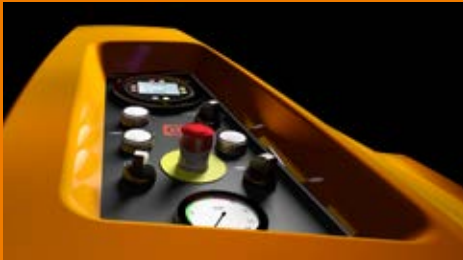
Alles im Blick mit dem neuen ergonomischen Bedienfeld – noch anwendungsfreundlicher