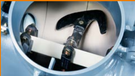
Großer Mischbehälter mit verschleißarmem Mischwerkzeug