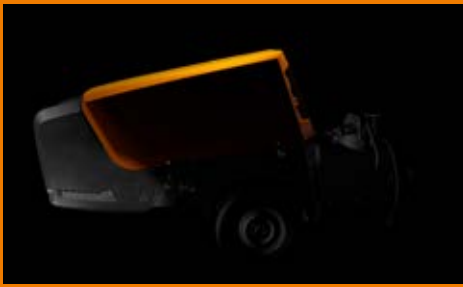
Effizienter und spritsparender Dieselmotor mit extra großem 70-Liter-Tank